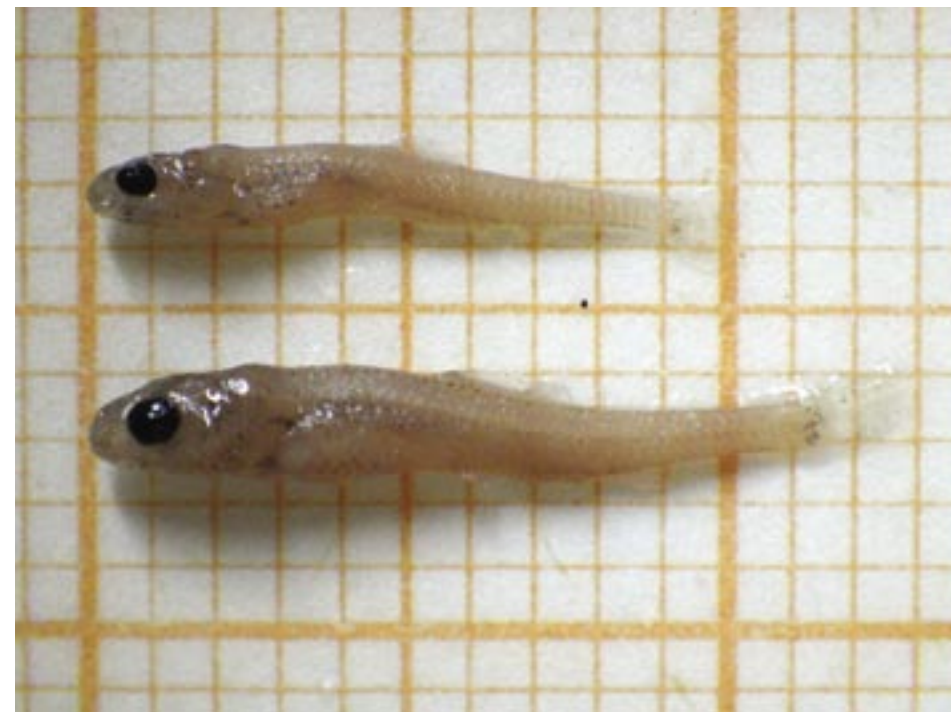
Abb. 1: Gründlingslarven von 10 und 13 Millimeter Länge nach Alkoholfixierung, gefangen am 21.5.1990, Sielwallstrand in Bremen.